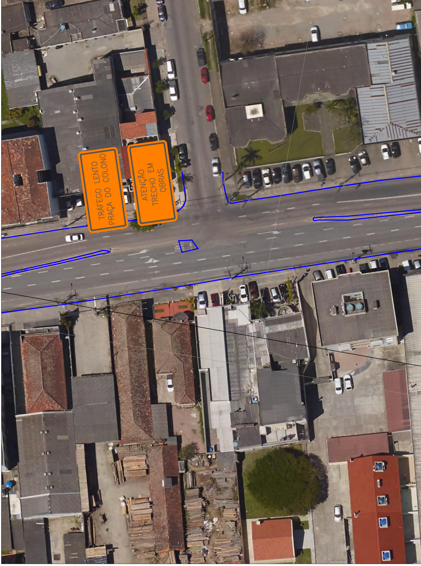
DETALHE 5 - SINALIZAÇÃO DE OBRA - PRAÇA DO COLONO ESC: 1:1000