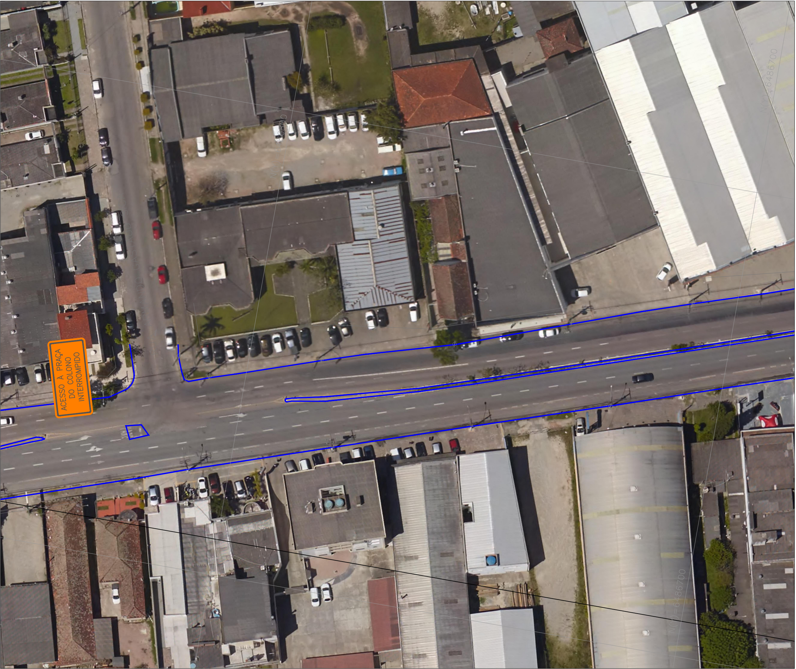
DETALHE 3 - SINALIZAÇÃO DE OBRA - PRAÇA DO COLONO ESC: 1:1000