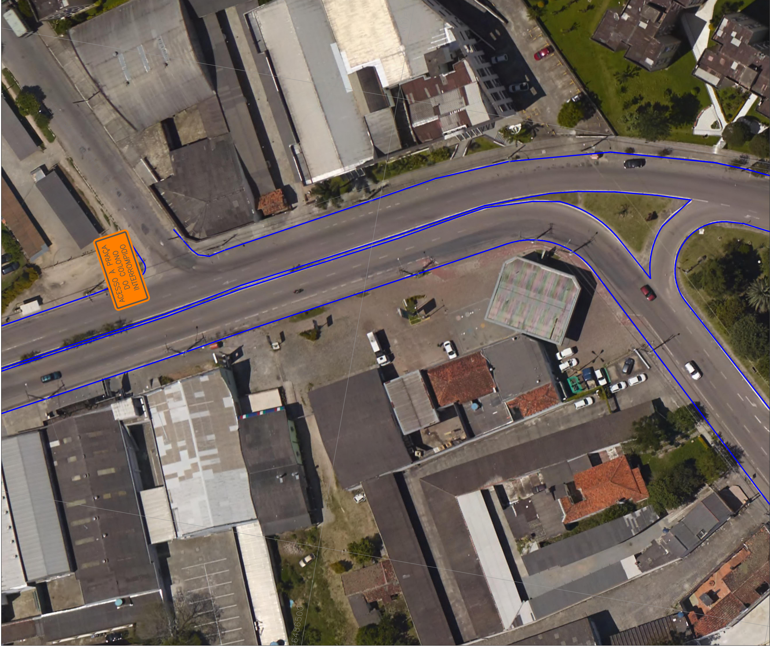
DETALHE 4 - SINALIZAÇÃO DE OBRA - PRAÇA DO COLONO ESC: 1:1000